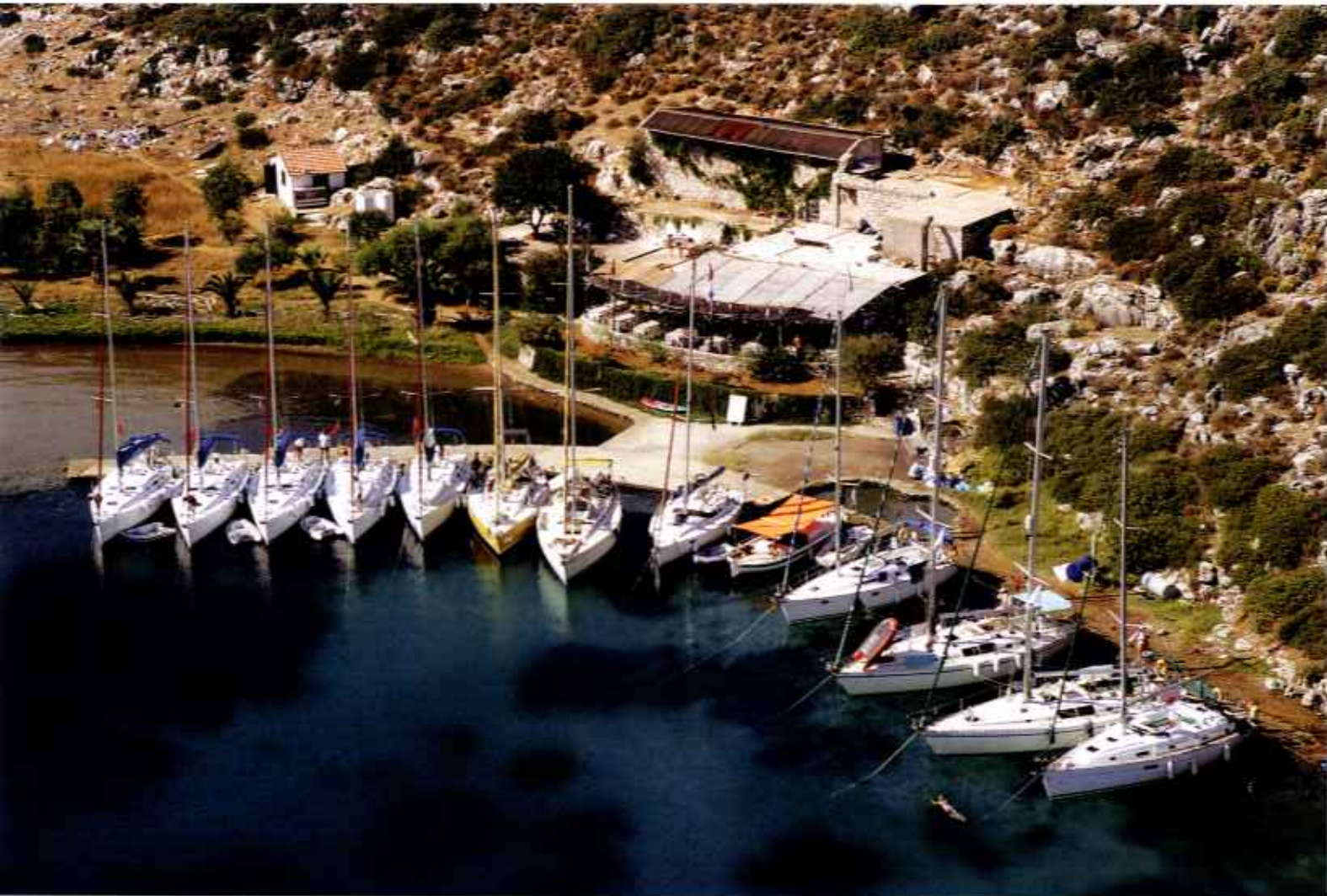
Auf der Restaurant-Terrasse in Dirsek lassen sich türkische Vorspeisen und ein herrlicher Blick auf Schiffe und Bucht genießen