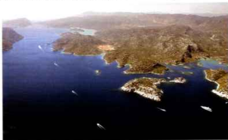
Mit Ankerplätzen geradezu gespickt zeigt sich aus der Luft der Kekova-Golf

Auf halber Strecke zwischen Kas und Finike liegt ein Archipel, der keine Wünsche offen lässt: jede Menge versteckte Ecken, Nischen und Winkel. Chartercrews können darin locker eine ganze Woche verbringen, ohne zweimal am gleichen Platz anzulegen. Im Bild vorn rechts die Gökkaya Limani, auf türkischen Seekarten auch als Asirli zu finden. Dort auf die Klippen achten, sie liegen rechts und links am Kurs und sind nicht alle ganz exakt in den Karten verzeichnet. Vor dem Restaurant im Scheitel der Bucht kann das Boot mit Ankerwache bleiben. Ein Ausflug nach Myra zur Nikolauskirche, den lykischen Felsgräbern und dem antiken Theater lohnt. Im Hintergrund leuchtet türkisfarben Ücagic, die Dreimünder-Bucht. Ringsum gibt es dort viele nette Restaurants. Im gesamten Buchtenarm und an den Stegen vor dem Dorf liegen Yachten sicher.