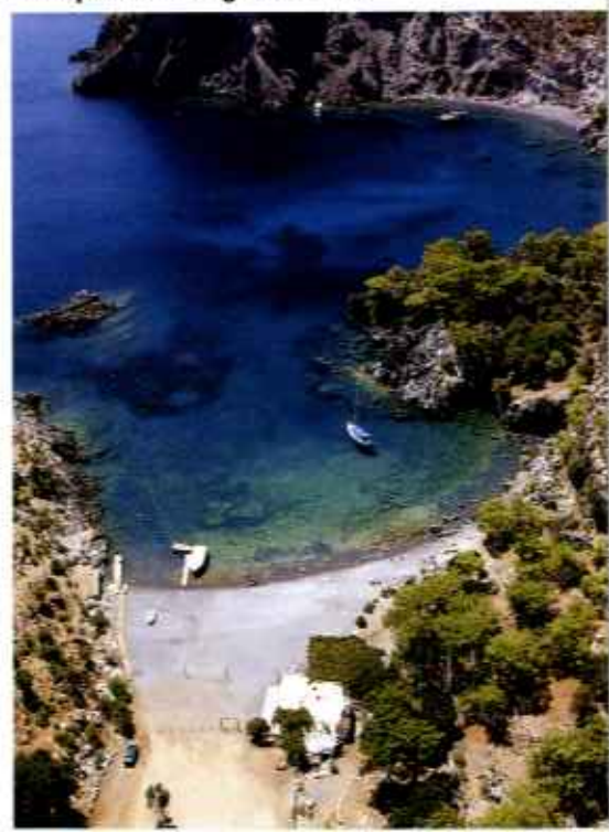
Ankerplätze in der grauen Bucht

Wenn draußen vor der Küste der Meltemi einmal zu ungemütlich wird, dann ist Dirsek ein idealer Zufluchtsort. Die Bucht, in manchen Seekarten noch als Agil Koyu verzeichnet, befindet sich am Ausgang des Hisarönü-, des Burgen-Golfs. Crews finden dort einen perfekt geschützten Platz fürs Boot. Und sie stoßen auf freundliche Menschen, die beim Anlegen helfen und unaufdringlich zum Besuch des Restaurants einladen. Auf den ersten Blick hat die Umgebung zwar nicht viel zu bieten. Ringsum ist es ziemlich kahl, und im Gegensatz zum hinteren Teil des Golfs wirkt die Landschaft um Dirsek sogar fast schon ein wenig abweisend. Doch ist die Yacht erst einmal am niedrigen Steinausleger im westlichen Teil der Bucht vertäut, nimmt einen rasch der stille Zauber des Platzes gefangen. Vor dem Restaurant liegen Schiffe auf drei bis vier Metern sicher, sofern genügend Kette nach Nordosten gesteckt ist. Von dort weht es mitunter recht heftig. Von der Terrasse hat man einen herrlichen Blick über die Bucht, und in der Restaurantküche darf den Köchen in die Töpfe geguckt werden. Ab und zu wird es unruhiger, wenn Charterflottillen die Bucht ansteuern. Lärm braucht aber niemand zu befürchten. Spätestens um Mitternacht sind alle in ihren Kojen.