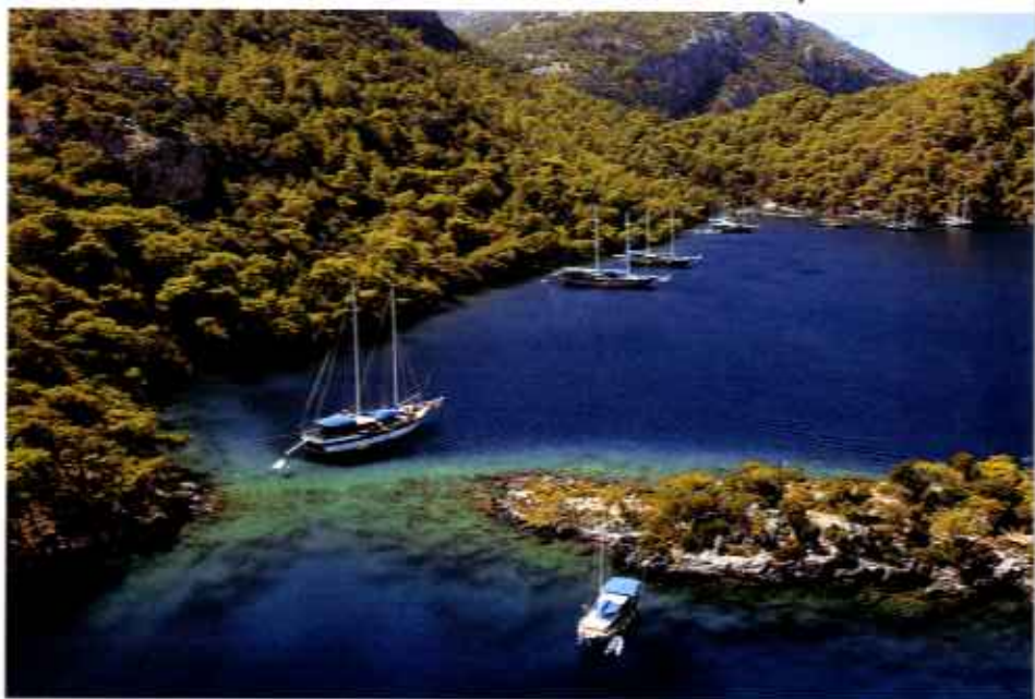
Die Klosterbucht im südwestlichen Fethiye-Golf

Die wohl schönste Bucht im Golf von Fethiye ist der schönsten Frau der Alten Welt gewidmet: Kleopatra. Sie soll der Legende nach in der Klosterbucht gebadet haben. Angeblich existierte sogar einst ein Badehaus. Später lag ein byzantinisches Kloster am Ufer, die Ruinen sind teilweise noch unter Wasser zu sehen. Da wundert es kaum, dass diese von dichtem Wald umsäumte Bucht mit ihren wildromantischen Felsklippen und idyllisch gelegenen Uferrestaurants der am meisten besuchte Ort im ganzen Golf ist. Gulets und andere Ausflugsboote sind ebenso viele anzutreffen wie Yachtcrews. Zum Glück ist genügend Platz vorhanden. Es gibt verschiedene Ankerplätze, die vor den vorherrschenden sommerlichen Winden geschützt sind. Fallböen können von Westen einfallen, ist doch gleich hinter dem Hügel das offene Meer. Die Yacht wird vor Buganker liegend zusätzlich mit einer Heckleine an Land gesichert. Gut freihalten sollte man sich von den Landvorsprüngen und Felsinseln.