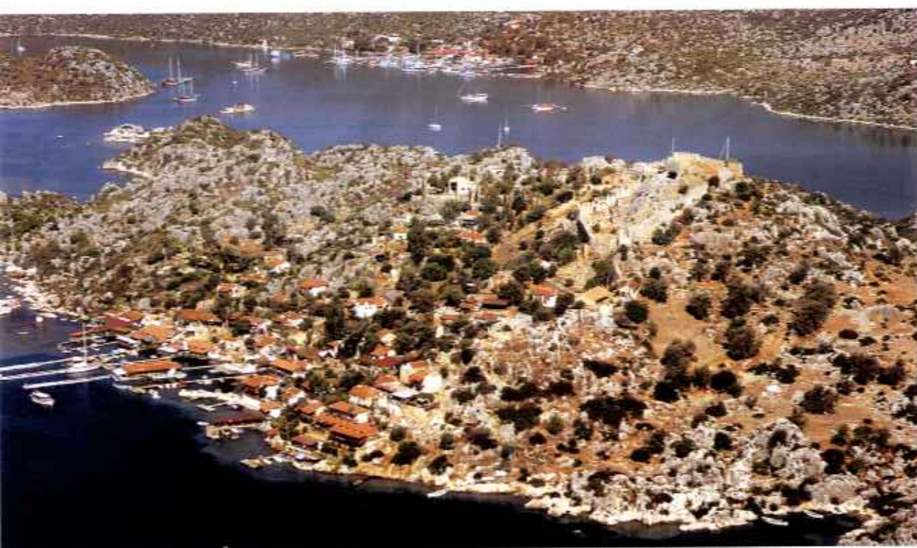
Einfache Stege unterhalb der Festung von Kale