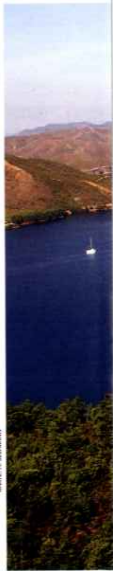
KARTE: H. SELTMANN

Wie in Abrahams Schoß. Vielen Yachten bietet die Windmühlenbucht Schutz. Dennoch herrscht dort eine überwältigende Ruhe