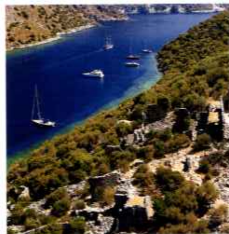
Yachten vor den Ruinen von Gemiler

der von den Einheimischen verehrte Maler Bedri Rahmi Eyüboğlu das Mittelmeer symbolisierend einen Fisch im Bauch eines anderen Fisches groß auf die Felswand gemalt. Daher wird die Bucht von vielen auch Bedri-Rahmi-Bucht genannt. Am Ufer gibt es einige einfache Lokale. Für die segelnde Kundschaft wurden nicht minder einfache Holzstege zum Anlegen ins Wasser gerammt. Diese Kneipen wechseln häufiger mal den Standort – werden abgerissen und andernorts wieder aufgebaut. In der Bucht fällt der Meeresgrund fast überall steil ab, deshalb empfiehlt sich beim Ankern, viel Kette zu stecken. Viele Plätze müssen sich Yachten mit Gulets teilen, die ebenfalls häufig in der Gegend vor Anker gehen. Doch die Zeiten, als sich die Kapitäne der urigen Holzschiffe mit voll aufgedrehten HiFi-Anlagen rücksichtslos ihren Weg bahnten, sind vorbei.