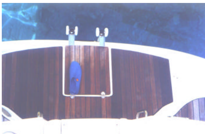
Abstand von den Rollen zu den Haltegriffen ca. 100 cm !!!! (Badeschuh gehört Erich und mißt 35 cm)

Ein SW Stärke 4 empfing uns, nachdem wir die Insel Sympy hinter uns gelassen hatten. Er hielt noch an, als Rhodos achteraus verschwand, flaute dann kurz ab, um aus NO wieder aufzufrischen, also genau aus der Richtung, in der das angepeilte Ziel lag. Kastellorizon bei Nacht anzusteuern erschien uns nach dem Blick in eine von Bertold mitgebrachte Reisebeschreibung wegen der vielen vorgelagerten kleinen Inseln doch zu riskant. Wir änderten deshalb den Kurs und hielten auf die Gemiler-Bucht zu. Für die Nacht suchten und fanden wir eine von weitem nicht auszumachende Mini-Bucht, die Bertold von früheren Törns her kannte und von ihm wegen der Stechwut bekannter Insekten schlicht "Wespenbucht" getauft wurde. Bei 5 m Wassertiefe warfen wir Anker und brachten wegen der Enge zusätzlich Landleinen aus. Der ausgesuchte Liegeplatz weist als Besonderheit auf dem Meeresgrund Quellen auf. Das aus ihnen gewaltig sprudelnde Süßwasser war zum ohnehin kalten Meerwasser geradezu eisig.