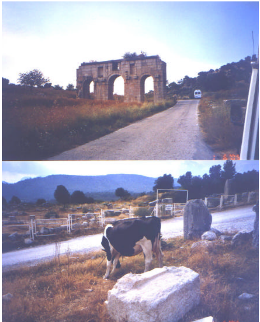
Ein römischer Triumphbogen und eine schwarzbunte Kuh aus Schleswig-Holstein (derzeit in türkischem Besitz).

Entschädigt wurden er (samt Walter) bei der Rückfahrt durch den Besuch eines riesigen Gemüsebazars. So knappe 6 bis 10 kg Obst, allerfrischester Tomaten, Zucchini, Gurken usw. kauften sie hier für unsere Bordküche ein. Preis für alles: 4,29 €!