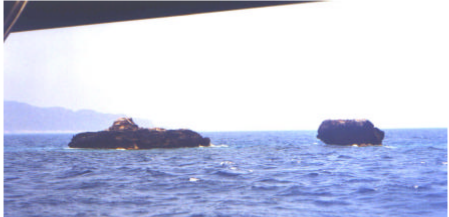
Die Rocky`s vor der Hafeneinfahrt Kastellorizon (nicht beleuchtet)

Am nächsten Tag wurde nun unser ursprünglich ins Auge gefaßtes Etappenziel, die Insel Kastellorizon, in unseren Törnplan navigatorisch ausgearbeitet. Unter Segeln liefen wir gegen eine Altdünung aus SW an. Nachdem wir längs der türkischen Küste laut Bord-GPS eine Weile