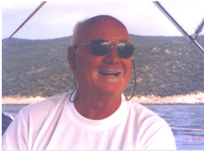
Das ausgiebige Vorkosten wurde vom Smutje für die Mannschaft deutlich erkennbar unter Beweis gestellt.