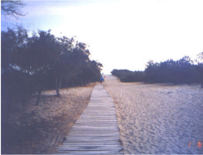
Wanderweg nach Patara

Einen Abstecher gab es noch zum 18 km breiten Sandstrand von Patara. Der frühere Hafen von Xanthos mit seinen Silos und Kaianlagen liegt unter Sanddünen begraben. Patara ist auch als Schildkrötenstrand bekannt und steht deshalb für einige Monate unter strengem Naturschutz.