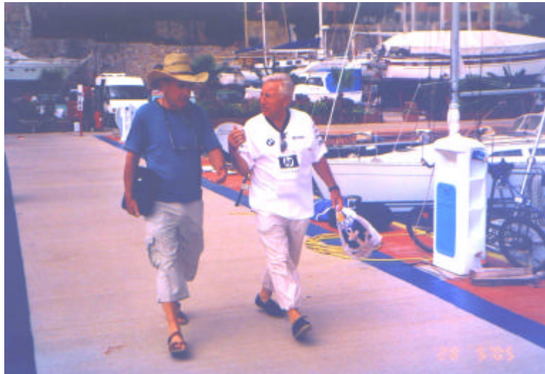
Auf dem eigens geschaffenen Laufsteg erfolgte selbstverständlich die Vorführung des neuen out-fits vom Schwäb. Albverein 2006

galt es, dem unter Pinien eingerichteten Fischlokal von Xantippe (spricht gut deutsch) Referenz zu erweisen. Hier durften wir einen wirklich hervorragend zubereiteten, mit der Dorade verwandten, gerade angelieferten Fisch verkosten. Der dazu gereichte türkische Wein war trinkbar, aber ein bißchen dünnflüssig, was wir zu spät bemerkten.