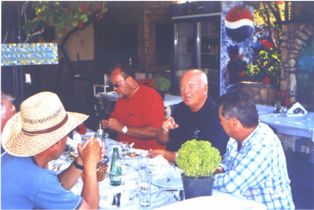
Kombüsen-Chef: "Hier wird gegessen, was ich bestimme!"

Unsere weiteren Bordgetränke konnten wir nur in klitzekleinen türkischen Supermärkten einkaufen. Einige Weinflaschen ruhen inzwischen auf dem Meeresgrund, da sich der Inhalt meist schon wegen des Korkgeschmackes als ungenießbar herausstellte. Erst am letzten Tag wurde uns der Rat zuteil, mit den Sorten Gankeya bzw. Selecjan Antik von der Weinkellerei Kavaklidere Vorlieb zu nehmen!