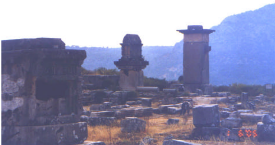
Das obere Bild zeigt eine korinthische (griechisch) Säule. Darunter die Grabstätten der Lyker.