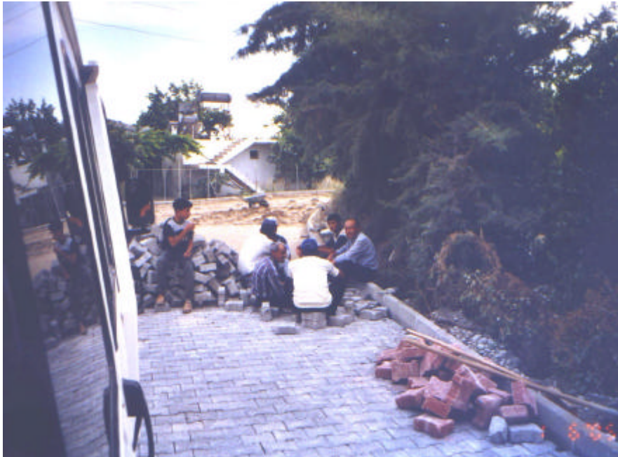
Wenn türkische Straßenbauarbeiter vespern, wird der Verkehr einfach stillgelegt.