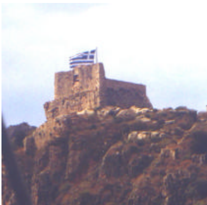
Vom Kastell, Namensgeber für die Insel, weht die größte je gesehene griechische Fahne.

Im Weltkrieg II befand sich auf diesem Eiland der größte Mittelmeerstützpunkt der Deutschen Wehrmacht, die hier seinerzeit auch den Flugplatz anlegte. Angeblich lebten hier einst 20.000 Menschen, was wir für unwahrscheinlich halten. Heute sollen es nach Auskunft eines Eingeborenen noch 350 sein. Zahlreiche Neubauten lassen Wachstum vermuten. Mit einem bescheidenen Tourismus hält man sich über Wasser. Auf die uralte Geschichte weisen die noch einigermaßen erhaltenen Ruinen eines Kastells (heute Museum mit einer Kanone aus aus dem thüringischen Sömmerda) hin.