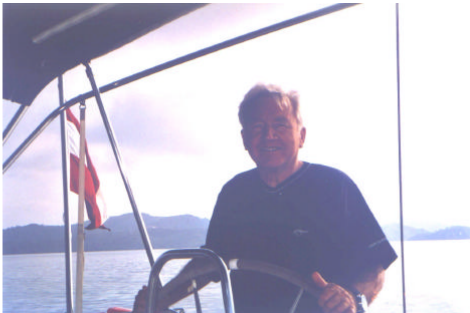
So sieht ein Geburtstagskind aus