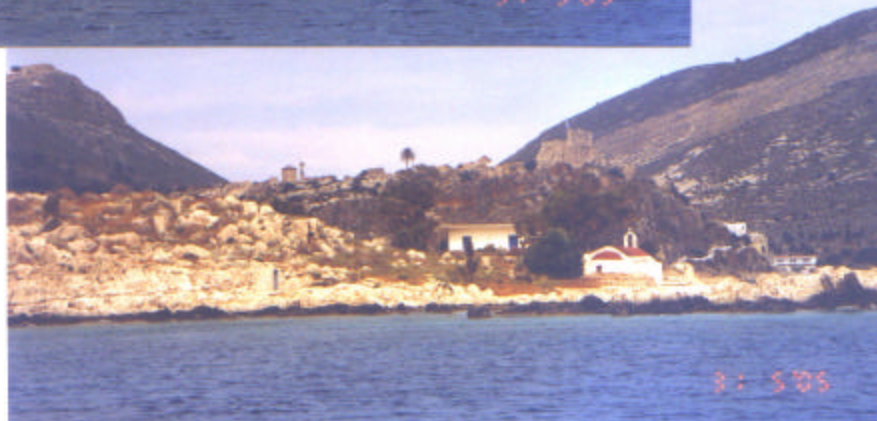
Die Moschee liegt rechts gleich hinter dem kleinen Hügel.