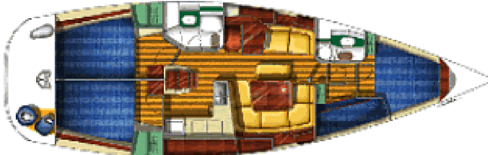
Segelyacht Sun Odyssey 43

Yachtcharter mit Komfort: die Sun Odyssey 43 verfügt über zwei Steuerräder, ein geräumiges Cockpit sowie klassisch elegante Linien