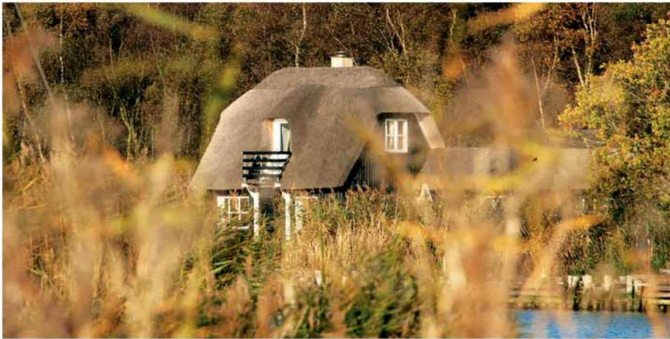
Landpartie per Segelyacht. Am schilfbewachsenen Ufer des Randers Fjord steht ein altes Fischerhaus