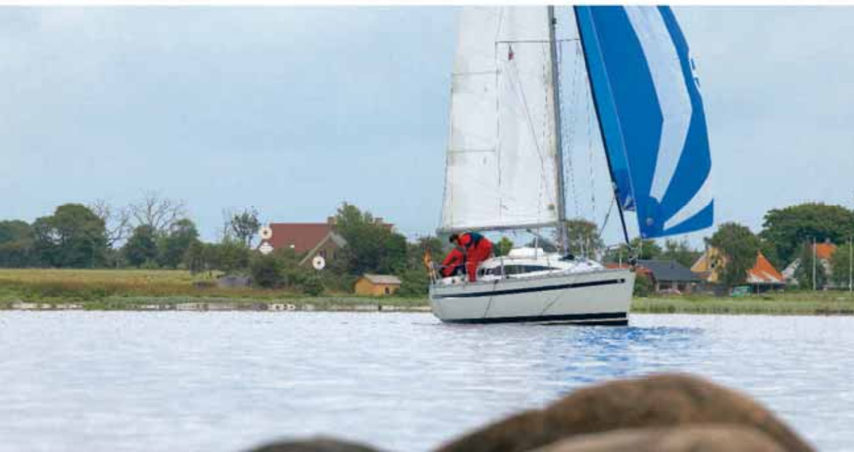
Sanfte Gleitfahrt im Horsens Fjord. Der ist breit genug, um ihn unter Segeln zu erkunden

Sehenswertes/Tipps Infos über alle Termine und Museen unter www.visithorsens.dk .