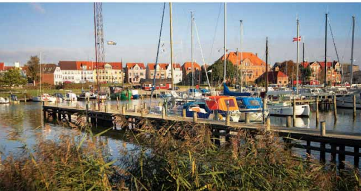
Einziges Ansteuerungsziel im Fjord: der Stadthafen von Haderslev

Sehenswertes/Tipps Der Fjord eignet sich gut für einen Abstecher auf fremdem Kiel, wenn man auf Årø eingeweht ist oder das Wetter einmal schlecht sein sollte. Das schöne Museumschiff „Helena“ pendelt zwischen dem Inselhafen und Haderslev. Die Fahrt kostet 130 Kronen. Infos: www.visithaderslev.dk .