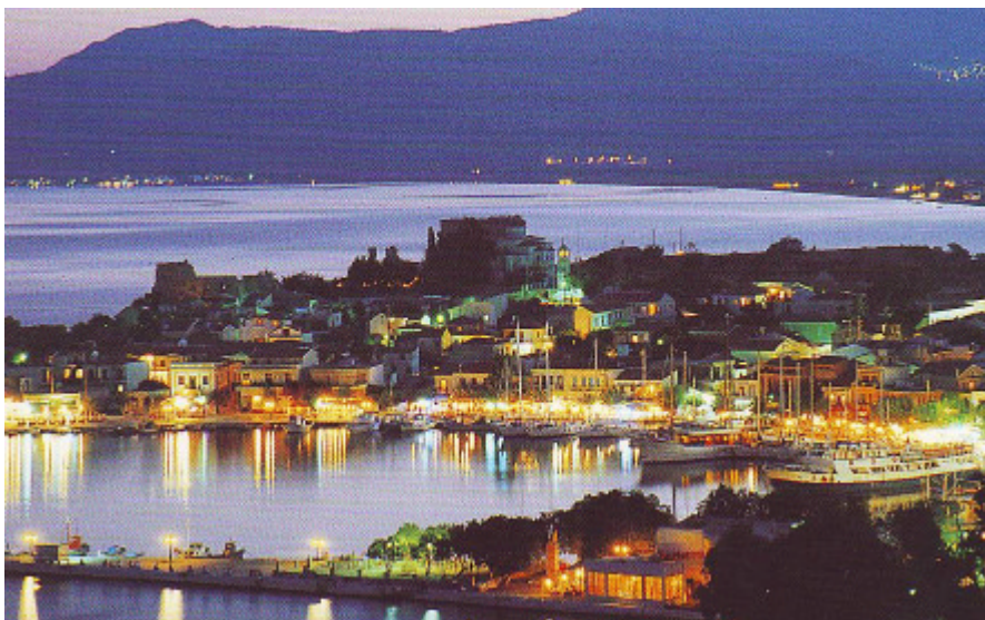
Die sagenhafte Uferpromenade von Pythagorio bei Nacht

ausgesprochen segelfaul! In früheren Jahren durfte der Motor nur unter seinen lauten Protestrufen angeworfen werden. Sowie die Athener, Spartaner, etc. ihre Tempel meist auf den höchsten Erhebungen errichteten, bauen die Orthodoxen ihre zahlreichen Kirchen und Kapellen auf hohe Berge.