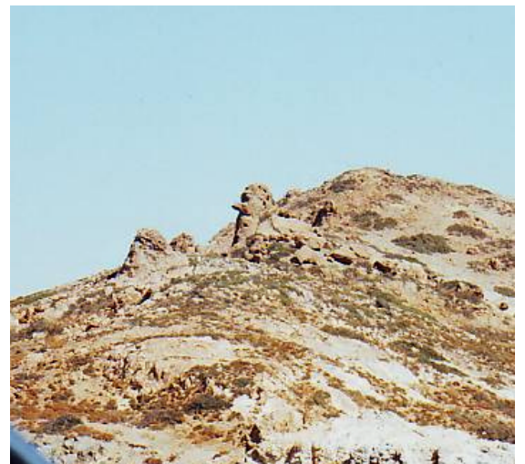
Dieser ca. 30 m hohe natürlich gewachsene „Nasenbär“ blickt zur Klosterfestung Patmos