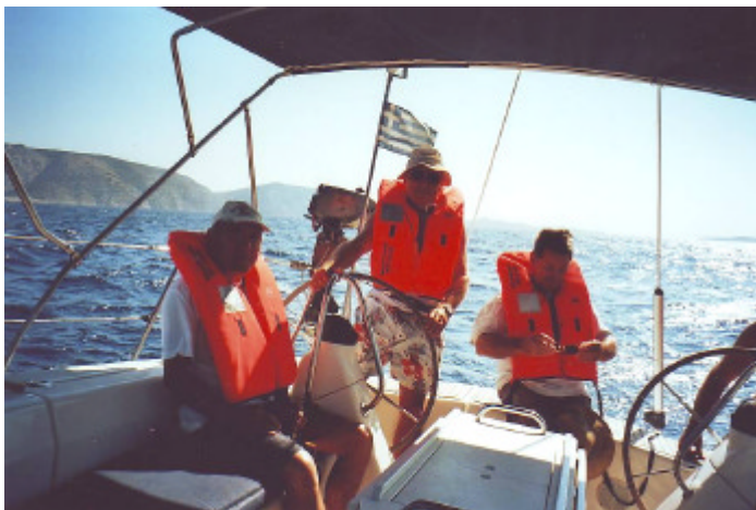
Kommando: „Rettungswesten an!“ ausgeführt!

Frühzeitig aber etwas verschlafen ging es dann am Sonntag zurück zum Ausgangsort. Wir wollten Samos mit langen Schlägen unter Segeln erreichen. Der Meltemi machte auch mit, legte aber nochmals auf volle Stärke zu. Aufgrund der sich hier besonders heftig aufbauenden Kreuzsee waren höhere Wogen nicht immer rechtzeitig auszumachen. So brachte uns eine geschätzte 5-m-Welle von Luv in bedenkliche Schräglage und eine noch höhere wälzte sich bedrohlich von achtern an. Sie schien allerdings zum Abschied zu lächeln, als sie unterm Heck verschwand. Natürlich reagierte der Skipper sofort mit den