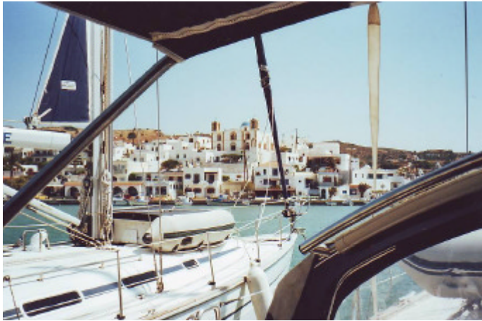
Lipsi bzw. Lipso mit seiner Hauptkirche (wir zählten noch 10 weitere Kapellen)

Olympiade oft erwähnt wurde, erhofften wir hier anständige sanitäre Einrichtungen. Doch Fehlanzeige! Aber wenigstens Wasser (ab 18.00 Uhr) konnten wir hier bunkern. Überhaupt lässt die hygienische Betreuung der Yacht-Touristen sowie die Versorgung mit Trinkwasser in Griechenland sehr zu wünschen übrig. Auf diesem Gebiet könnten die Hellenen von den Osmanen einiges lernen! Das vom Hafenmeister ersatzweise