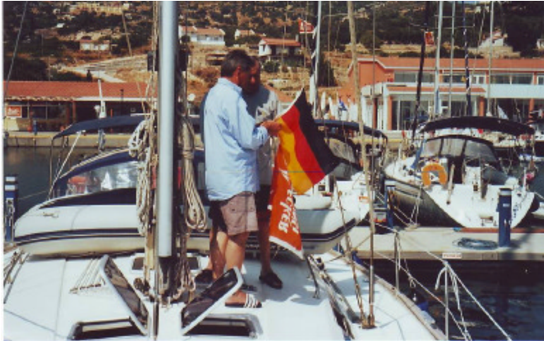
Erste Handlung an Bord: Hissen der Gastflagge!

neuen Marina, die etwas außerhalb liegt, kann man sich in die Stadt mit einem Taxi hinfahren lassen (5,00 €) oder sich zu ihr über einen mit vielen Schlaglöchern versehenen 8 km langen, staubigen Schotterweg entlang der Küste zu Fuß hinbegeben. Der berühmten Volkloremusik, vorgetragen von kleinen Kapellen in den verschiedensten Restaurants, durften wir nicht lauschen. Werktags wird nicht musiziert!