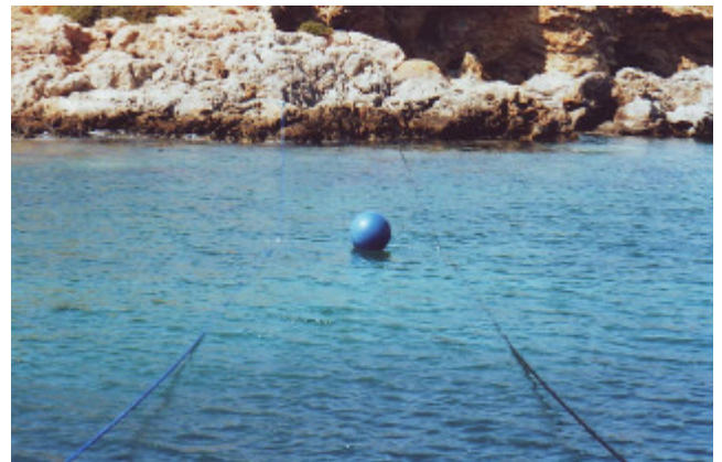
Mustergültige Sicherung unserer Beleg-Leinen

Kaum in Ruhestellung rauschte noch eine 18-m-Yacht in die Bucht ein, am Heck eine übergroße Halbmond-Flagge. Sie schien hier zu Hause zu sein, denn sie fuhr rückwärts ziemlich dicht an das Ufer, 2 Mann schwammen gezielt auf einen Felsen zu, belegten blitzschnell und beendeten im Nu das Manöver. Gestaut haben wir deshalb, weil uns abgeraten worden war, die Türkei anzusteuern. Von dort kommende Patrullenboote würden einen häufig wegen