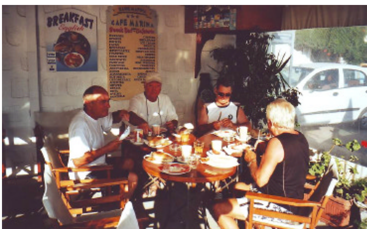
...und so eine englischer Geburtstags-Breakfast-Tafel

Danach legten wir bei starkem Meltemi zu unserer letzten Station, der Insel Arki, ab. In der malerisch gelegenen, normal windgeschützten Bucht Porto Augusta, der eine Reihe winziger