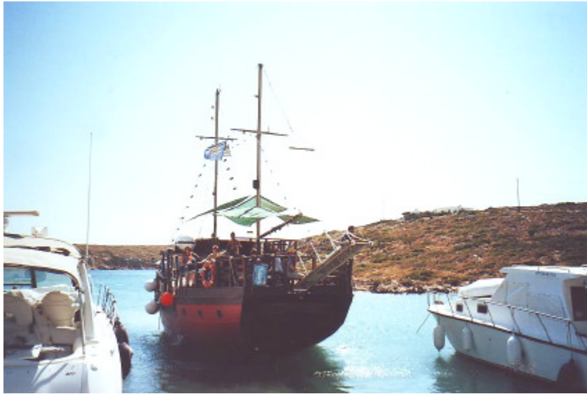
Phantasievoller, griechischer Touristentransporter