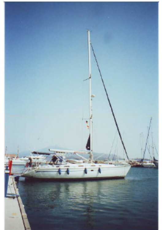
Die Bavaria 47 mit dem 20,4-m-Mast

bestückten Supermarkt direkt am Hafen großzügig ein und begaben uns abends erst mal auf die beeindruckende Uferpromenade von Pythagorio, eine der schönsten im ganzen Mittelmeerraum. Hier reihen sich Restaurants, Weinlokale und Geschäfte aneinander. Besucherströme aus aller Herren Länder bevölkern sie und sorgen mit den Einheimischen bei dichtem Gedränge für ein besonderes Flair. Von der